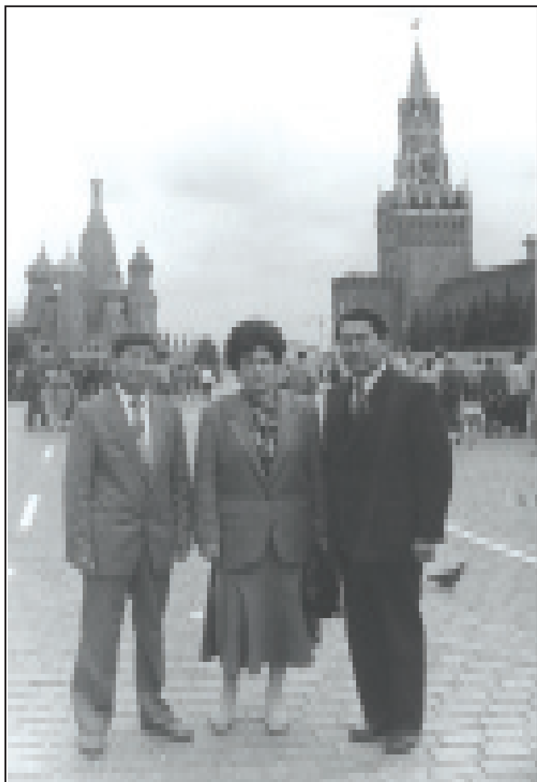
Москва, 1990 йыл