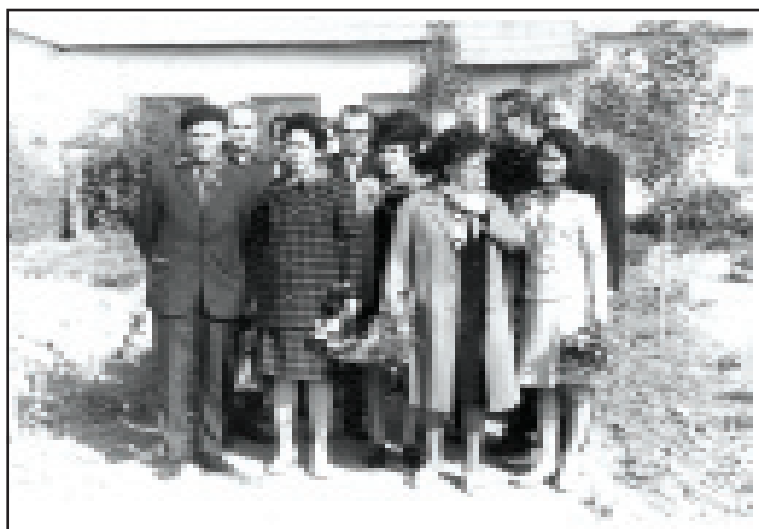
Яздың яркын куйинде...