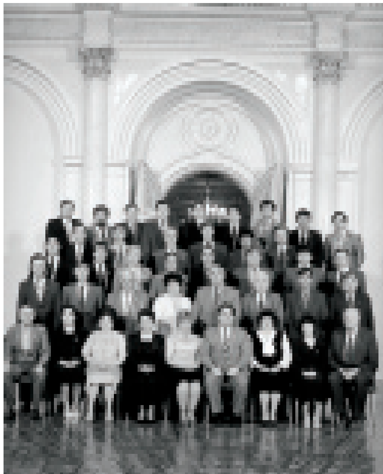
XXVIII съезд КПСС Москва, Кремль, июль 1990 г.