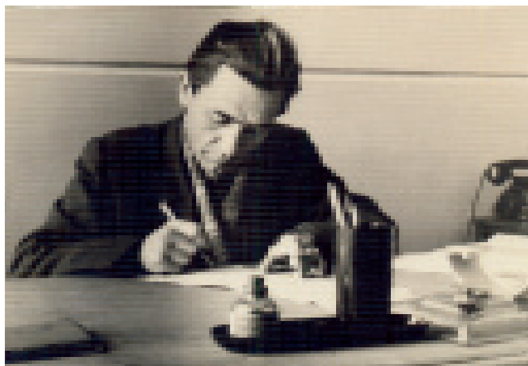
Калем колга туьскенде...