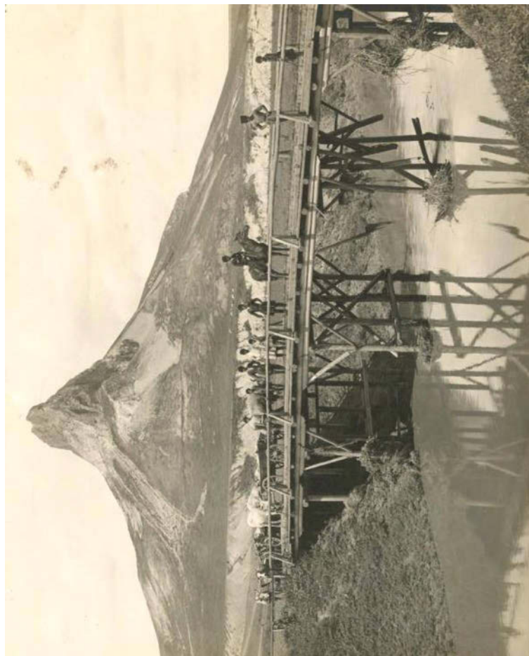
Рисунок 16. Жители аула Канглы на мосту через реку Суркуль. На заднем плане гора Кинжал. Кавказ, Пятигорье 1890 год.