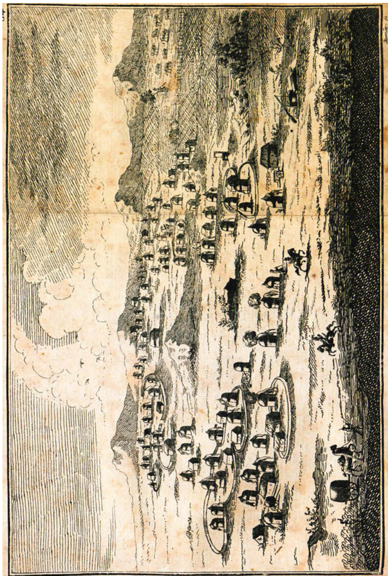
Рисунок 2. Н. Э. Клемми. Поселение ногаев Буджакской орды. 1768–1770 г.