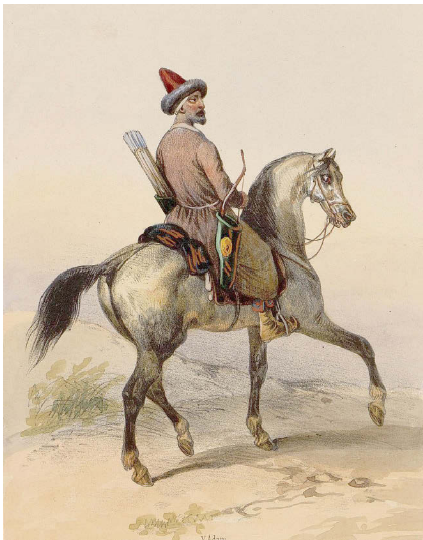
Рисунок 10. Жан Виктор Адам. Гравюра. Ногаец, 1830 год.