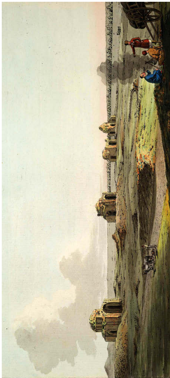
Рисунок 4. Х. Г. Гейслер. Иллюстрация. Ногаи на фоне руин города Маджар. 1793–1794 гг.