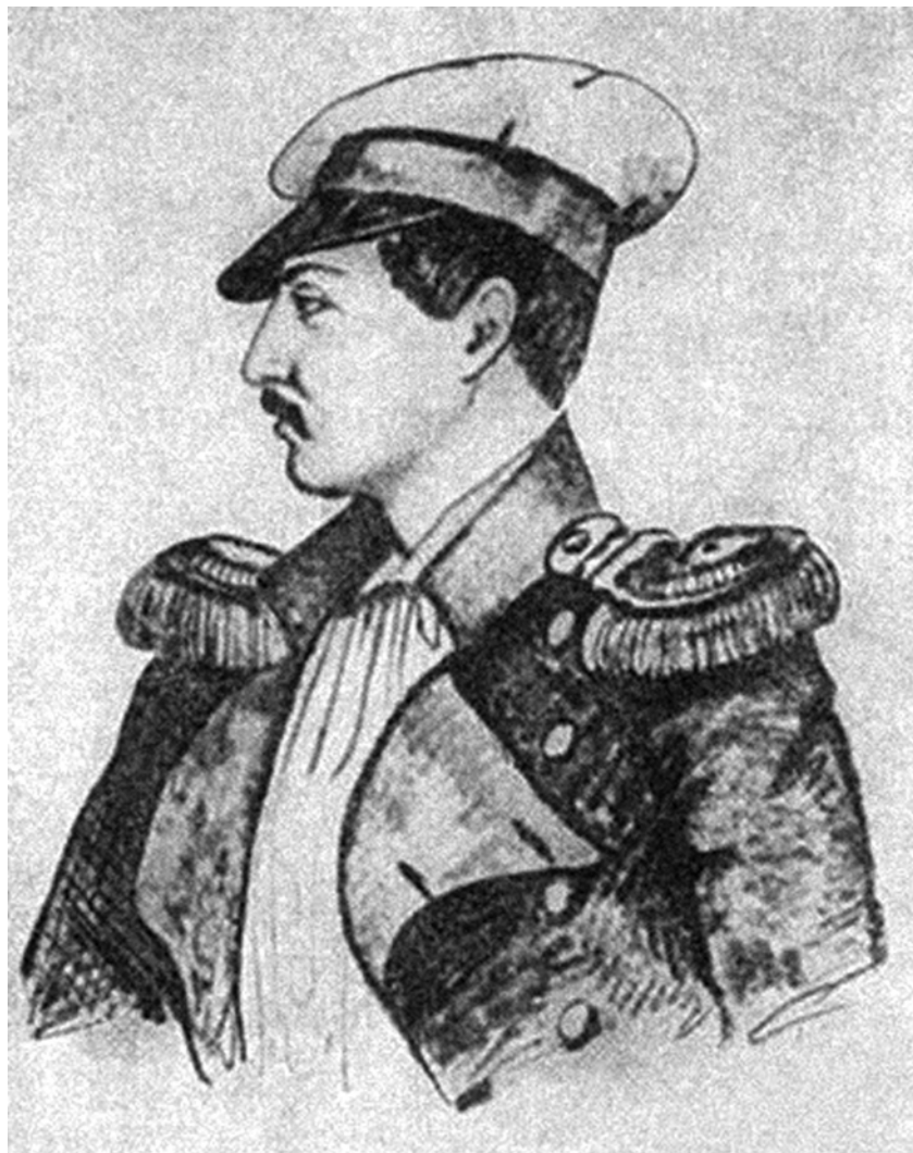
Рисунок 9. Г.Г. Гагарин. Ногайский Султан Казы-Гирей. 1840-е годы.