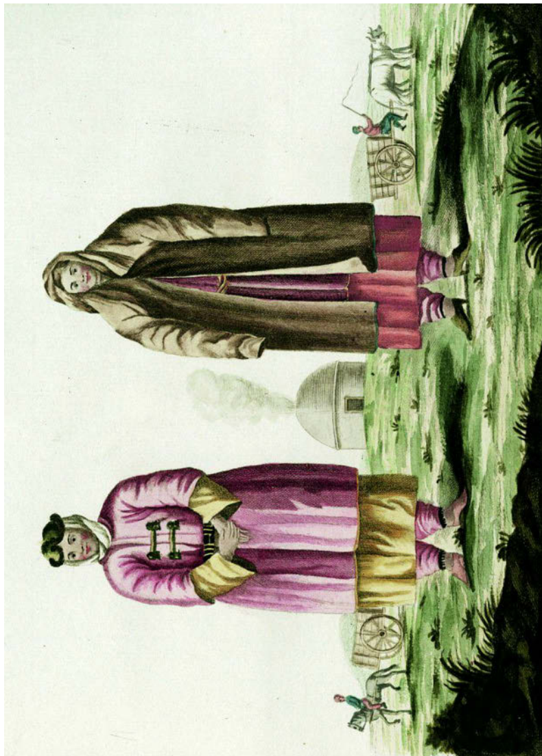
Рисунок 3. И.А. Гольдеништедт. Терские ногайки. Терек. Ногайская степь. 1768–1775 гг.