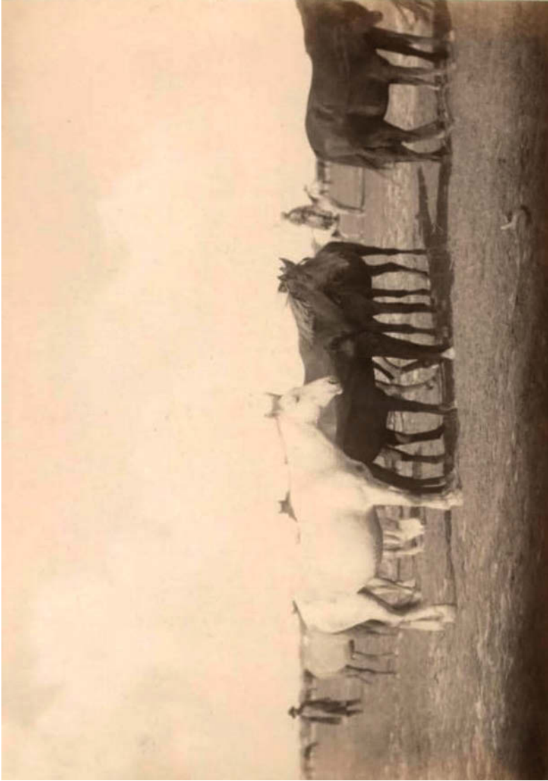
Рисунок 7. Ногайские табуны. Общий вид косяка.