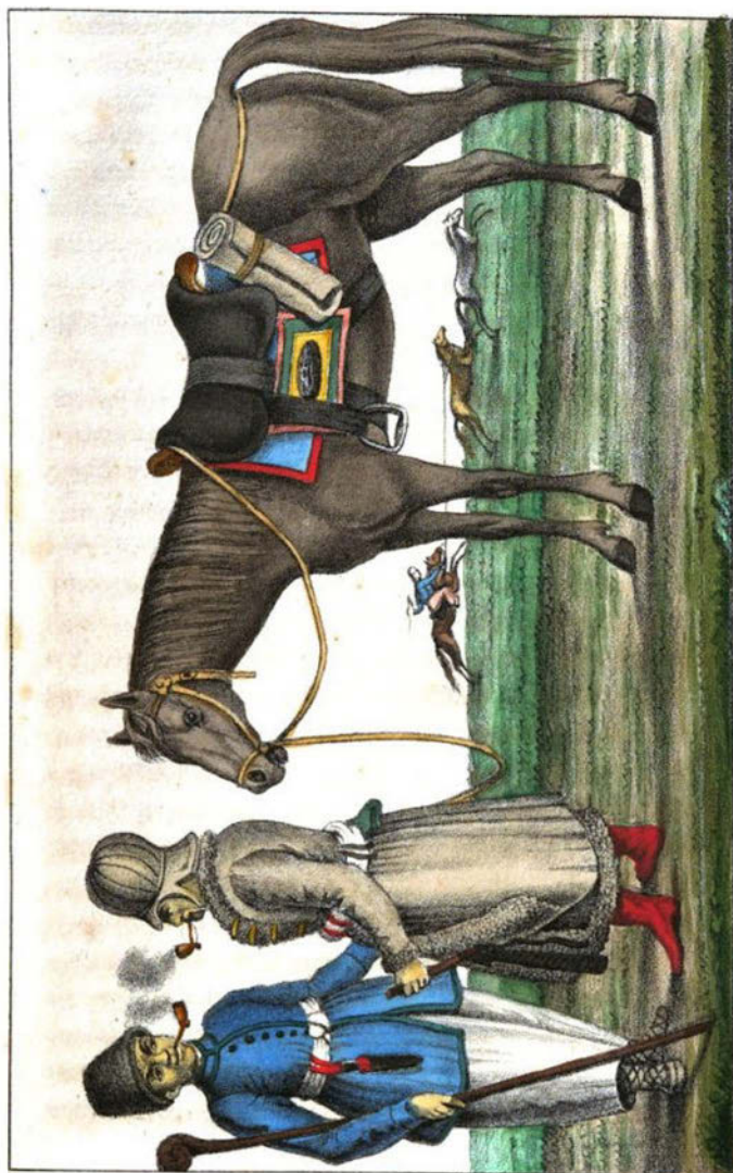
Ногайцы - Татары.