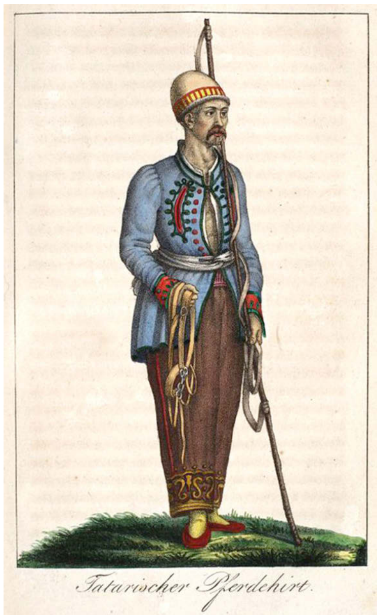
Рисунок 13. Даниель Шлаттер. Гравюра. Ногайский пастух. Северное Приазовье. 1822–1828 гг.