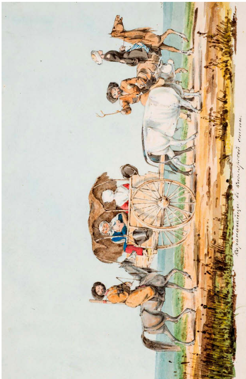
Рисунок 8. «Кавказский альбом». Караванщики в Кизлярской степи. Ногайские степи, Кавказ. Середина XIX века.