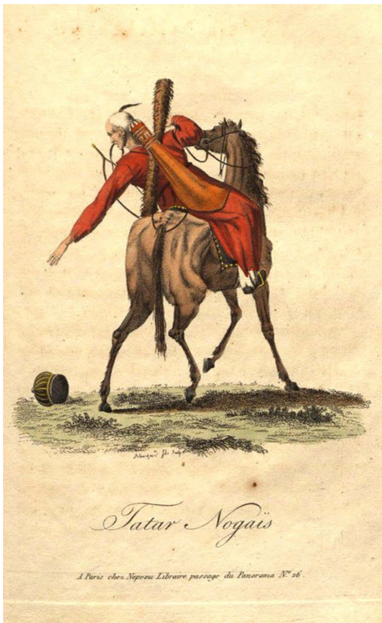
Рисунок 6. Блانشар Огюст. Гравюра. Ногайский воин. 1812 год.