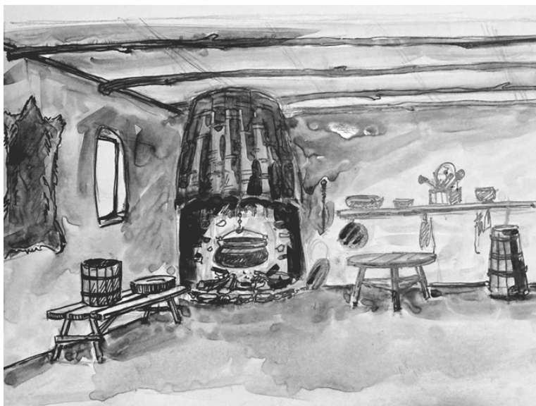
Иллюстрация художника Ю. Б. Карасова